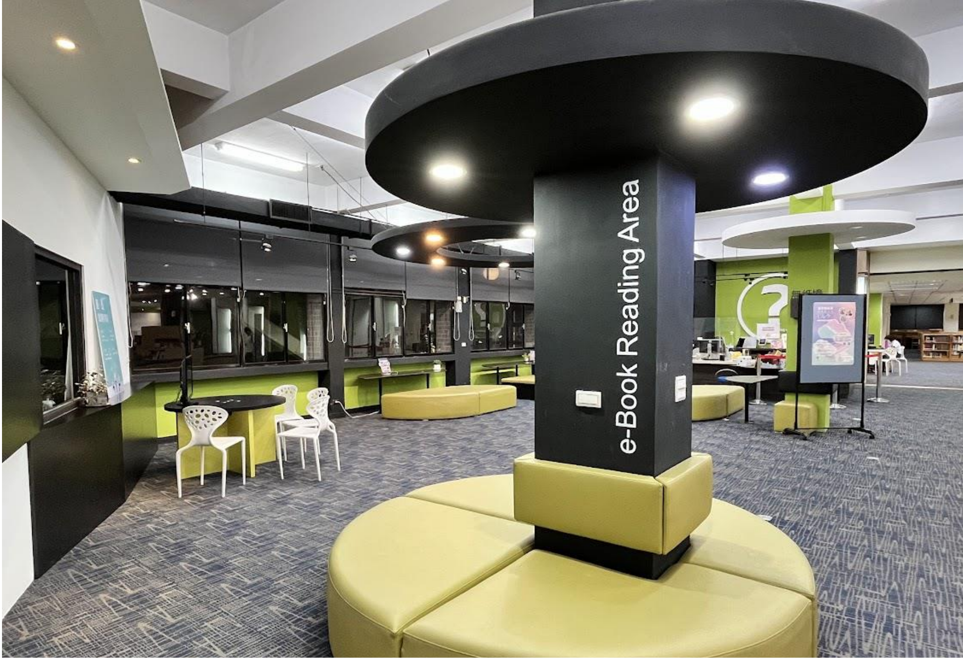
一樓無紙境電子書區