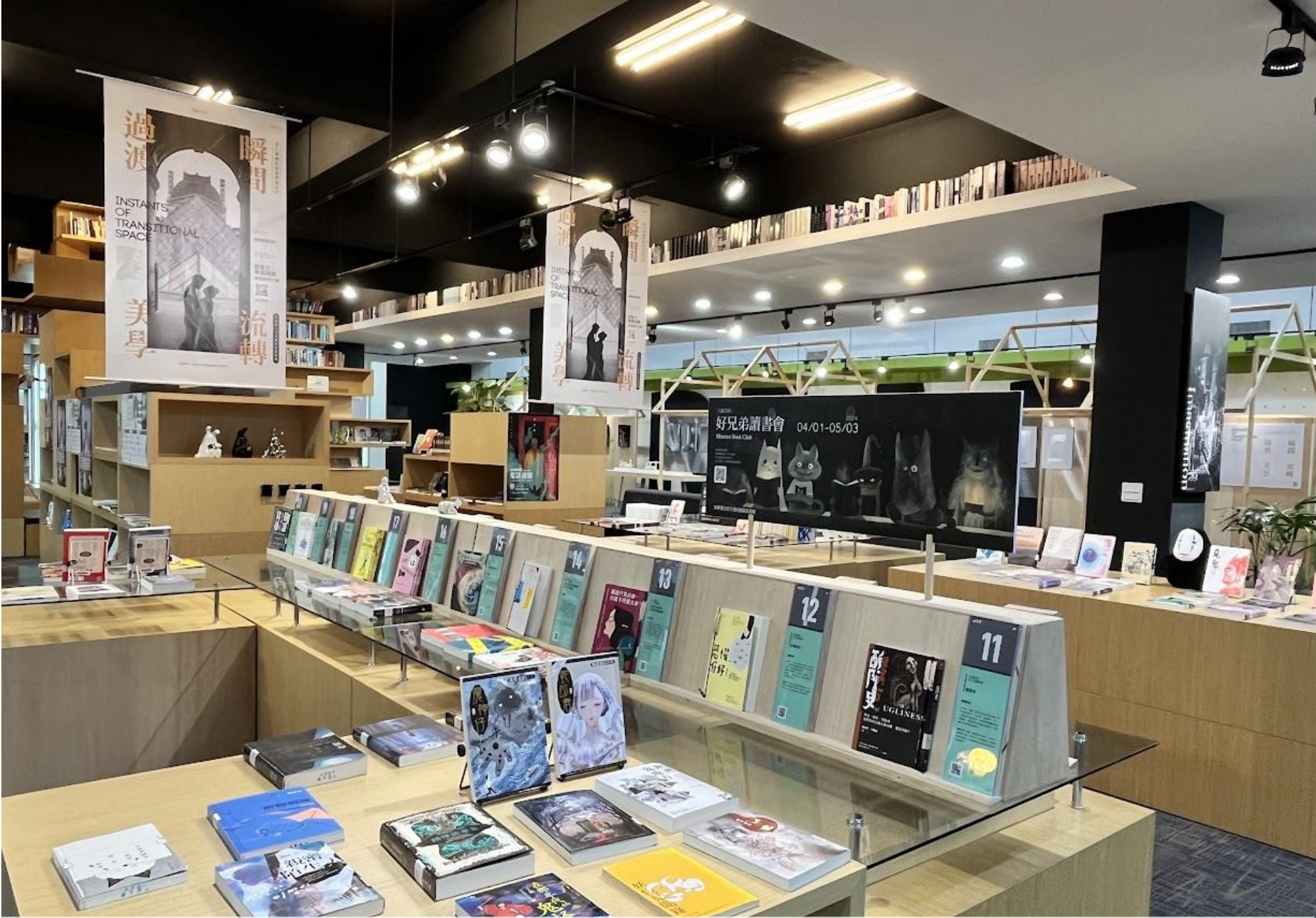
一樓書城主題展示區