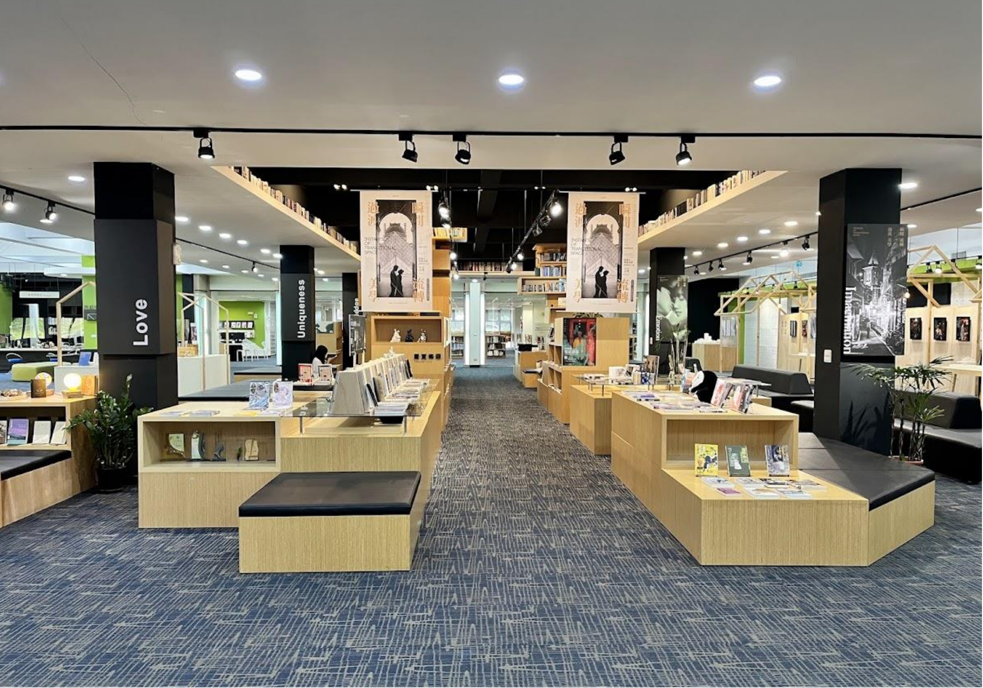
一樓書城主題展示區